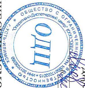
ГРАФИК ПЛАНОВО-ПРЕДУПРЕДИТЕЛЬНОГО РЕМОНТА И ПРОФИЛАКТИЧЕСКИХ ОСМОТРОВ ЭЛЕКТРООБОРУДОВАНИЯ ЗДАНИЯ ПО УЛ. МЕЧТАТЕЛЕЙ 21-А НА 2022Г.