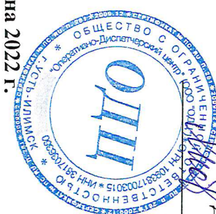
График осмотров вводных распределительных устройств многоквартирных домов жилого фонда правобережной части города на 2022 г.